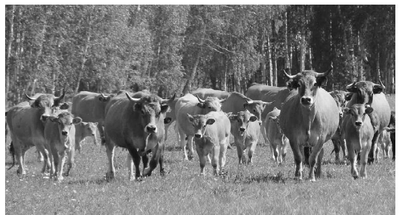
Обрак - любимая порода предпринимателя, его мечта - получить идеальное маточное поголовье