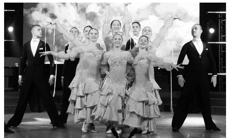
Свои творческие номера труженикам сельского хозяйства подарили кавер-группа «Il sogno», вокальный ансамбль «Primavera», учебный театр «Территория танца», фольклорный ансамбль «Радovesь», сборная Тюменской области Формейшн «Вера дубль»