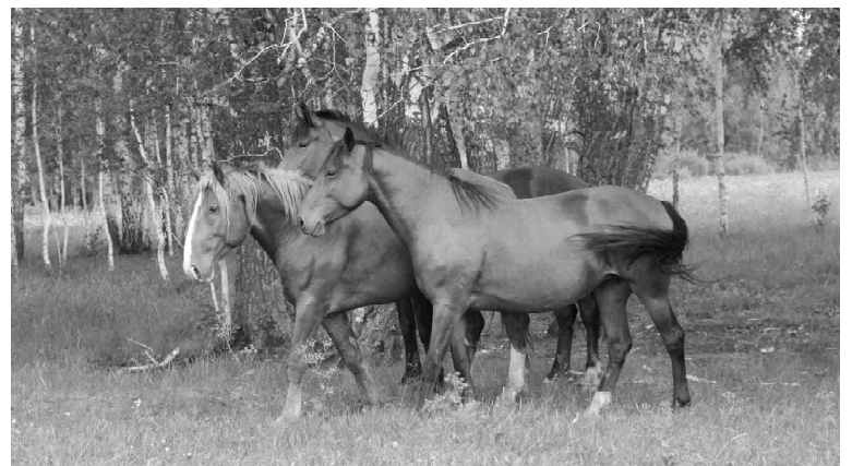
Новоалтайская порода мясных лошадей прижилась в хозяйстве