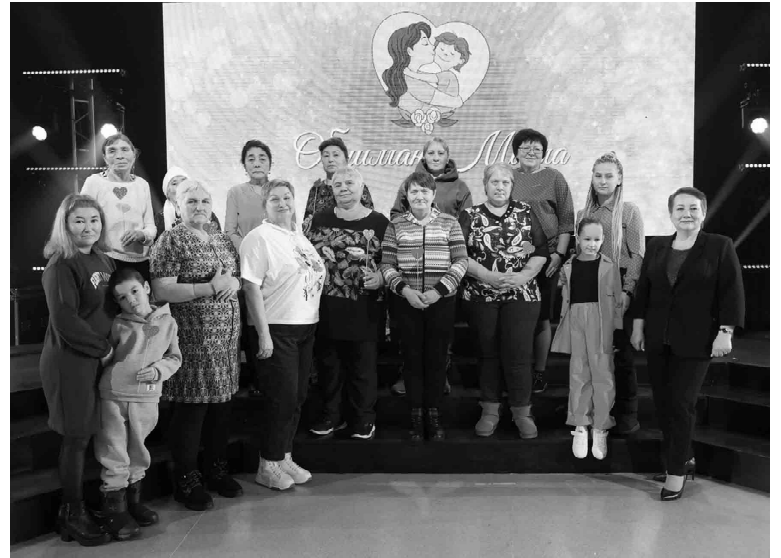
Семьи участников СВО часто посещают мероприятия районного Дома культуры

объявил Годом семьи. Это говорит о том, что на государственном уровне очень высоко ценится институт семьи и главная задача - сохранение семейных ценностей и традиций.