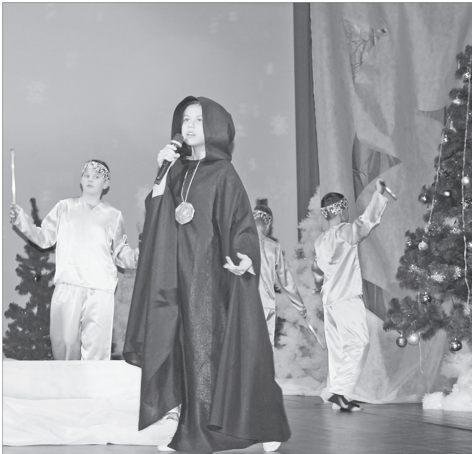
📷 Фрагмент постановки «Притча о Лазаре».

– Мы тщательно, но неспешно работаем над созданием постановок, – рассказала матушка. – Ребята приходят на занятия, и мы прорабатываем сюжет, подбираем подходящих для ролей актёров, продумываем мелочи. Результат очень радует нас. Но как оказалось, учитывая все отзывы, которые сыпались и продолжают сыпаться отовсюду, данная картина понравилась очень многим. Работа на месте не стоит, и мы продолжаем готовить уже другие постановки, – близится Пасха, другие праздники, и у нашего коллектива всегда очень много дел, идей и устремлений.