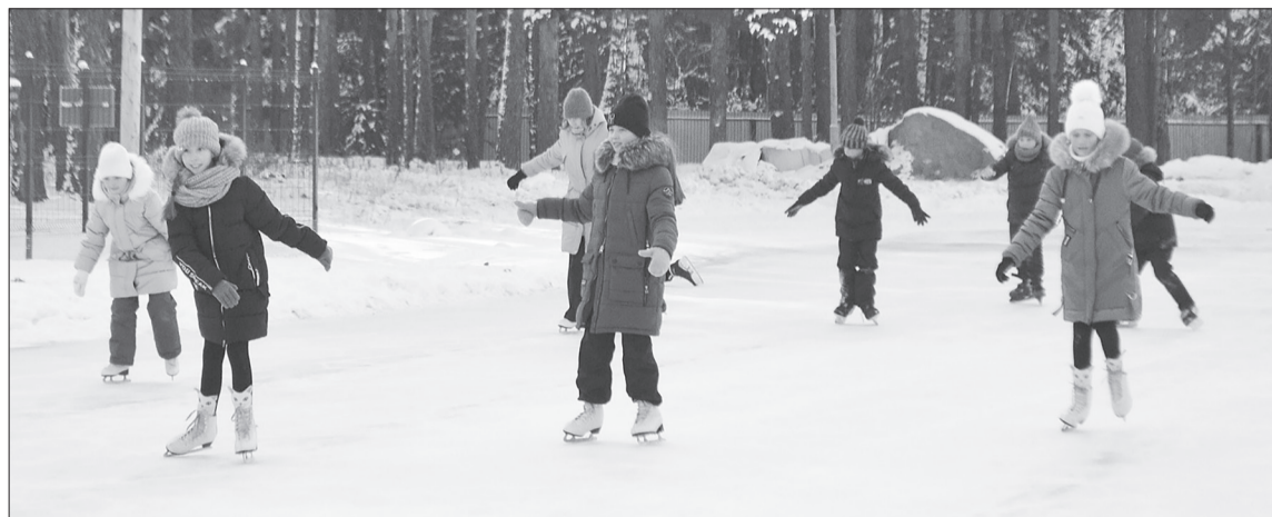
Подвижный образ жизни ведёт к здоровью.

Предлагаем несколько рецептов лёгких салатов. Первый. Нарезаем небольшими кусочками отваренные куриное филе и яйца, свежий огурец, зелень петрушки или кинзы, посолить, поперчить, добавить консервированную кукурузу, заправить натуральным йогуртом или сметаной, перемешать.