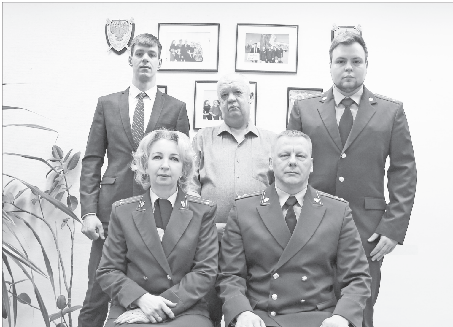
■ Дружный и ответственный коллектив прокуратуры Нижнетавдинского района.