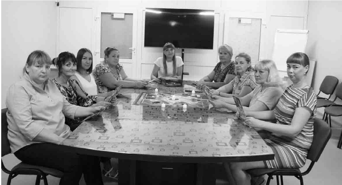
Работники Социально-реабилитационного центра для несовершеннолетних собрались на очередную игровую встречу

Специалисты СРЦН экспериментируют с инновационными техниками