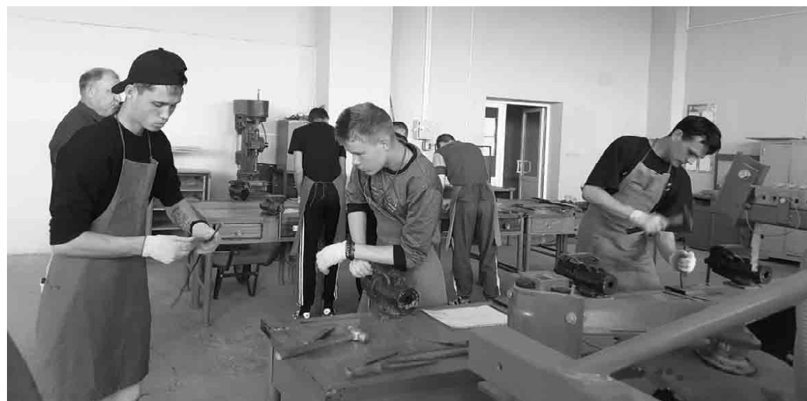
Конкурс профессионального мастерства в самом разгаре

Этапы выполнения задания оценивала конкурсная комиссия в составе старшего мастера