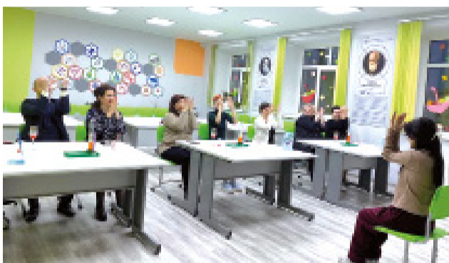
Фото школы №12

Радушно, под марш юных барабанщиков встречали гостеприимные хозяева коллег. А затем была экскурсия по обновлённой территории, где было что посмотреть.