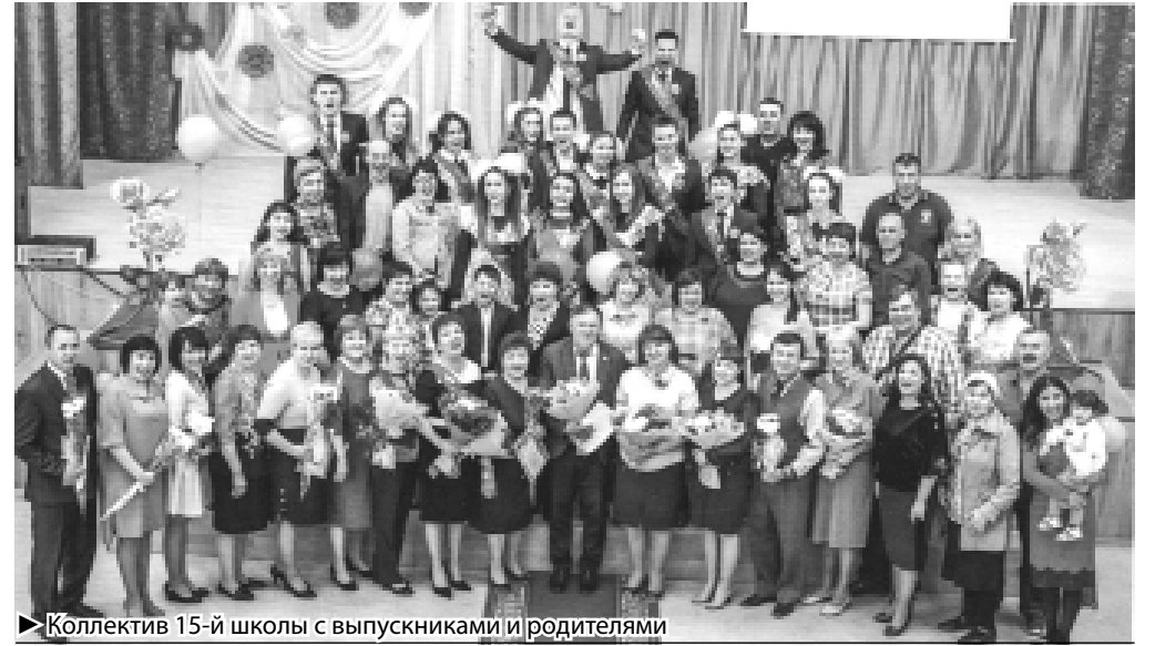
► Коллектив 15-й школы с выпускниками и родителями

В настоящее время школа является муниципальным