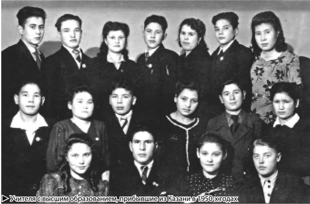
► Учителя с высшим образованием, прибывшие из Казани в 1950-х годах