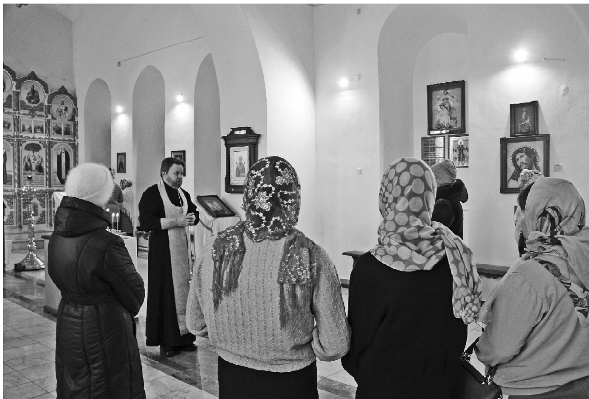
➤ Поминание погибших воинов