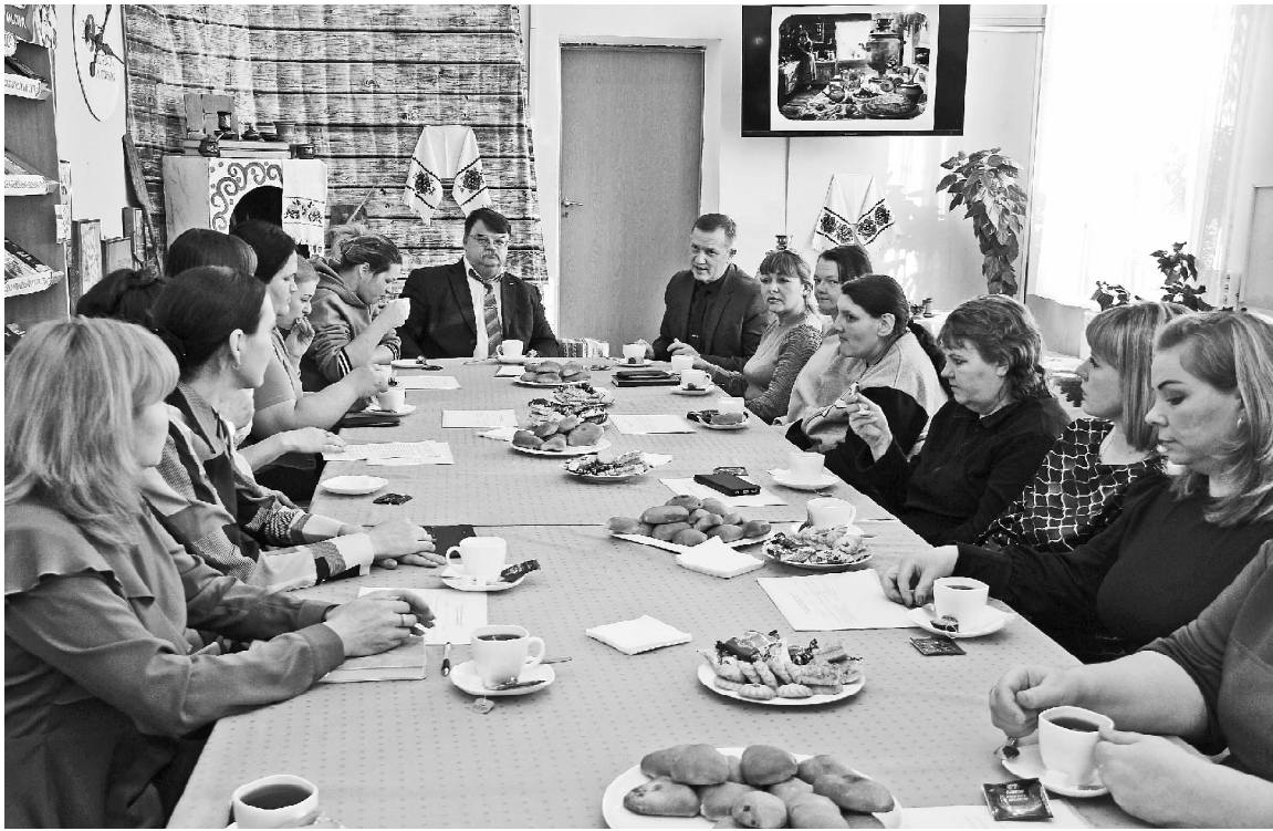
➤ Беседа в социальной гостиной о семейных ценностях

Социальная гостиная для семей участников специальной военной операции и многодетных семей открыла двери в Викуловской районной библиотеке.