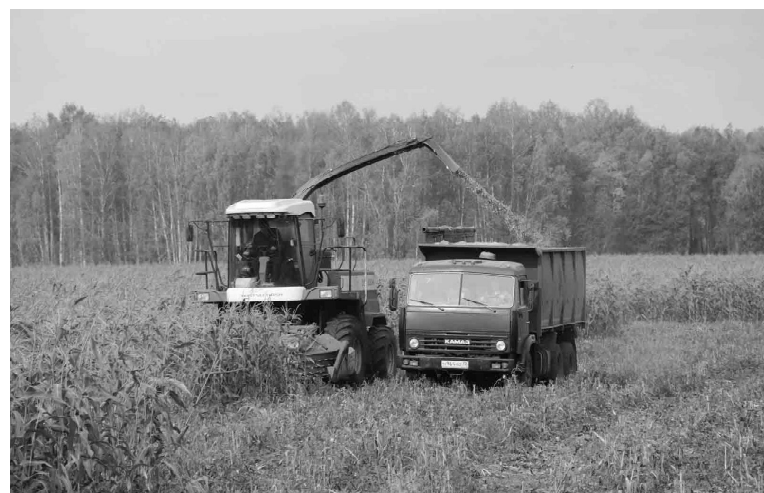
В ООО «Бизон» на заготовке кормов задействованы комбайны, КАМАЗы, тяжелые трактора