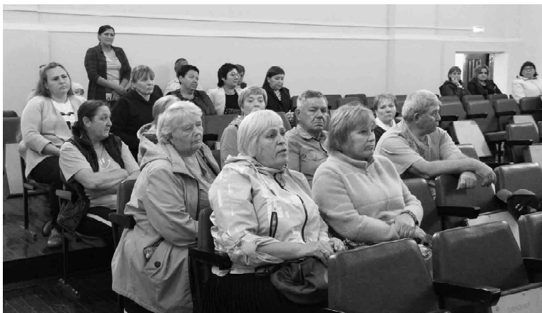
В селе Большой Краснояр живут неравнодушные люди