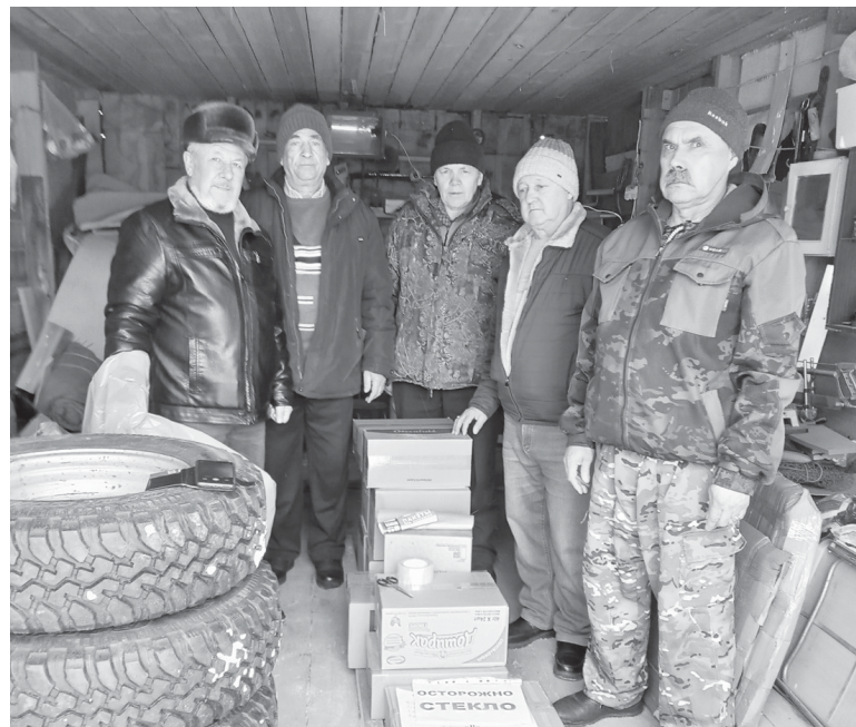
На снимке: Ветераны ГСВГ упаковывают гуманитарную помощь