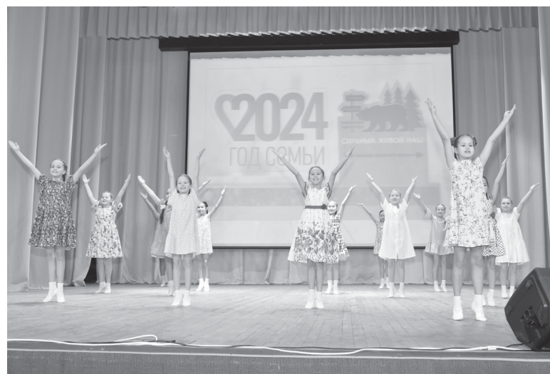
Детский танец «Мама» в исполнении ансамбля «Калинка»