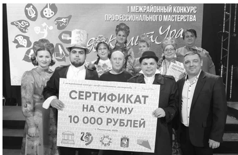
Победа в конкурсе стала для аромашевцев неожиданной

В районном Доме культуры состоялся I межрайонный конкурс профессионального мастерства «Я - КультУра!» среди культурно-досуговых учреждений клубного типа юга Тюменской области.