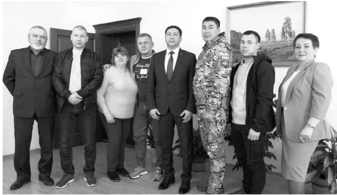
Настрой у военнослужащих боевой, говорят: назад не отступим!

Марина НИКОНОРОВА