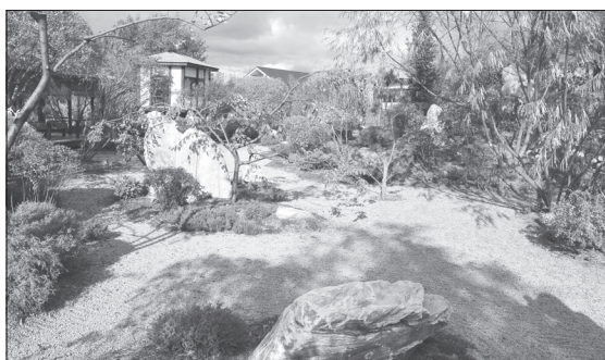
Чарующее впечатление создаёт японский сад «Ива Парк» в Тюмени. Этому стилю присущи уравновешенность элементов, чувство меры и гармонии. Считается, что он помогает избавиться от стресса