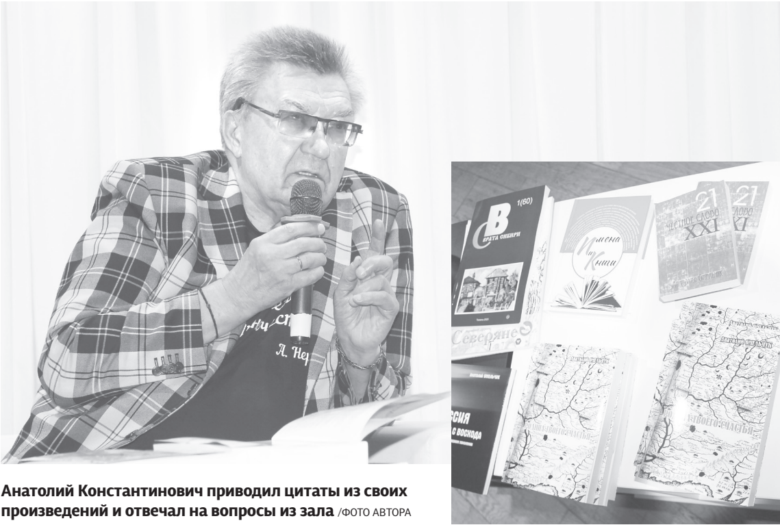
Анатолий Константинович приводил цитаты из своих произведений и отвечал на вопросы из зала

«Автор скромно, но отчаянно надеется, что книга «Родина твоего счастья» станет достойным учебным пособием для уроков родиноведения во