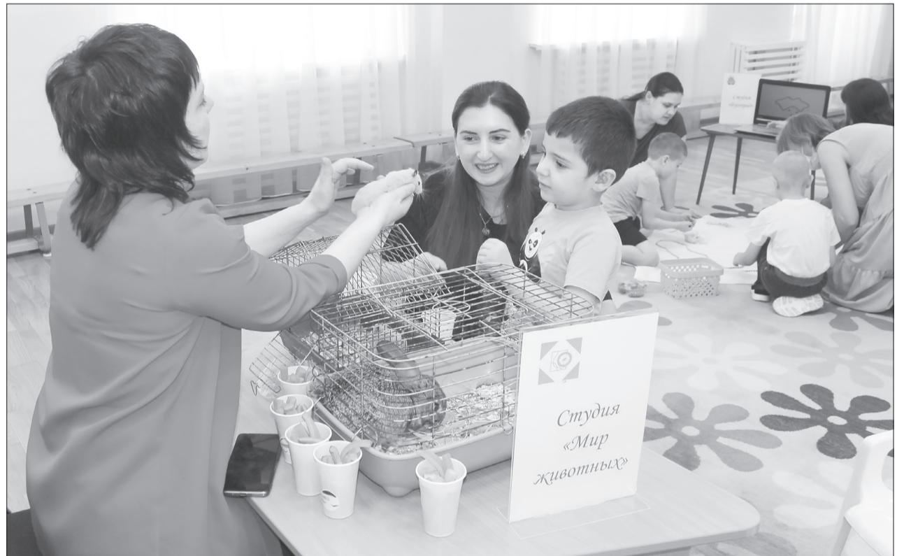
Самые яркие эмоции у детей вызвали животные, которых разрешали кормить и даже гладить

В Ялutorовске прошёл фестиваль для детей с ограниченными возможностями здоровья