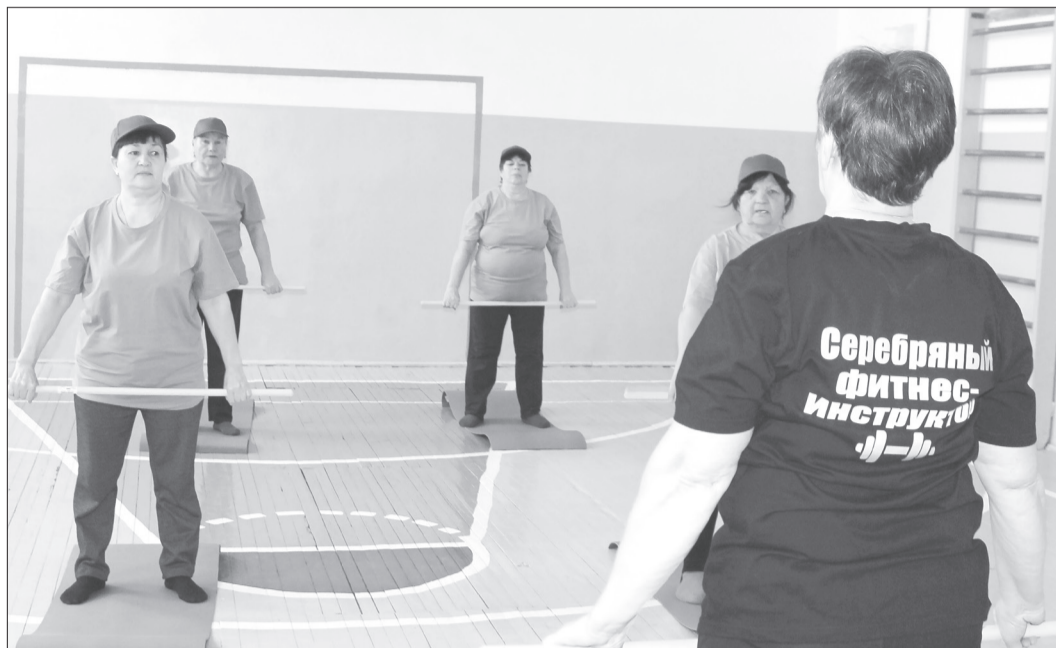
В городе и районе для пенсионеров бесплатно проводят занятия по фитнесу. Этим летом количество инструкторов, а значит, и групп увеличится

Мудрить при выборе вида спорта не нужно. Самое простое - это ходьба. 8-10 тысяч шагов считается нормой. Зимой подойдут лыжи, летом - велосипед. Набирает популярность скандинавская ходьба. Она даже рекомендована в качестве реабилитации после перенесённых заболеваний, переломов, операций. В клубах начинающим подойдут оздоровительная йога, комплекс для здоровья спины, стретчинг, занятия в тренажёрном зале. Универсальный вид нагрузки - плавание. Недавно в на-