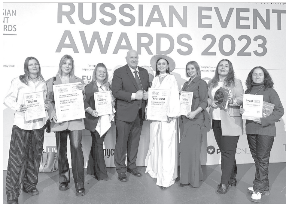
«Ялutorовская Масленица» получила Гран-при Международной премии Russian Event Awards - 2023