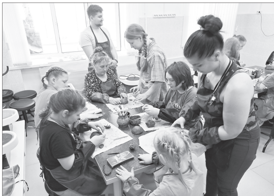
В проекте «Арт-выходные» Детской школы искусств им. С. И. Мамонтова участвовали многодетные семьи и семьи мобилизованных жителей города