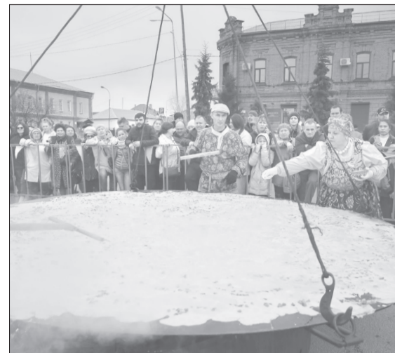
Главным блюдом праздника будет мировая яишня