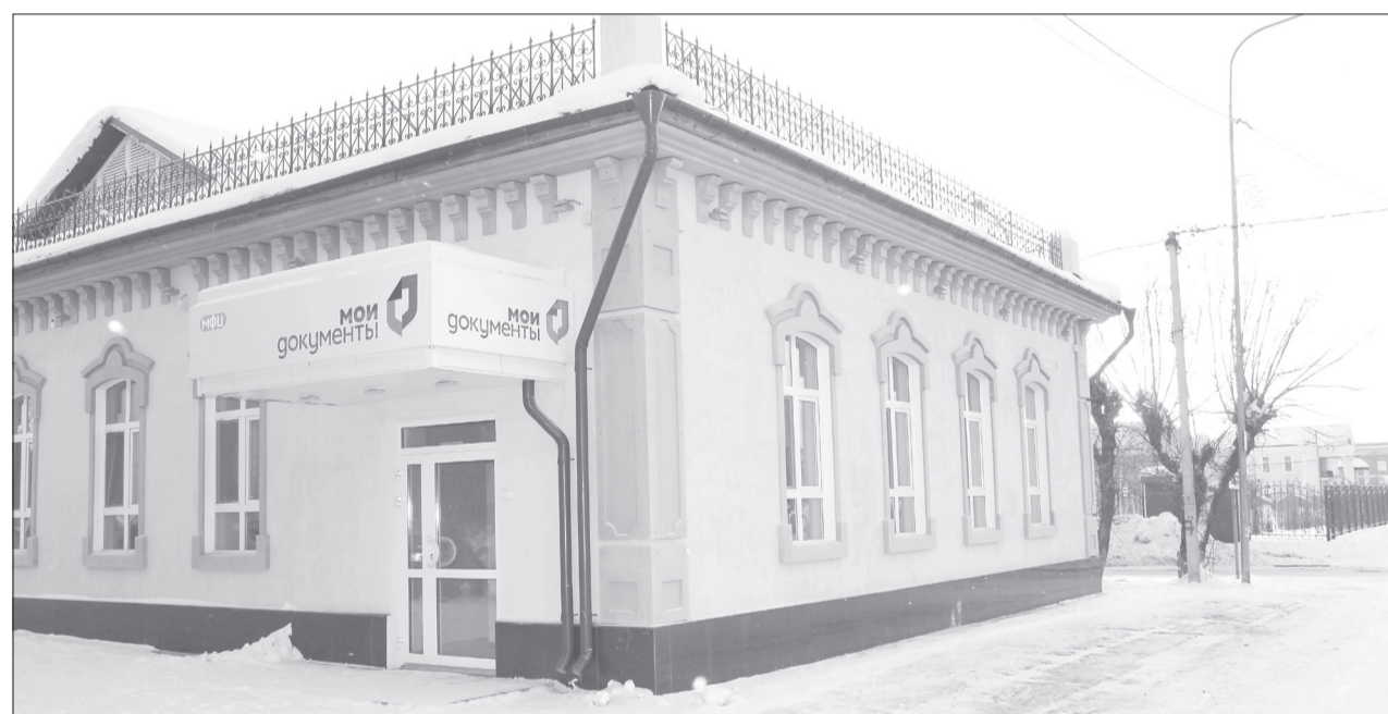
В отличие от прежнего здания у нового два входа вместо одного