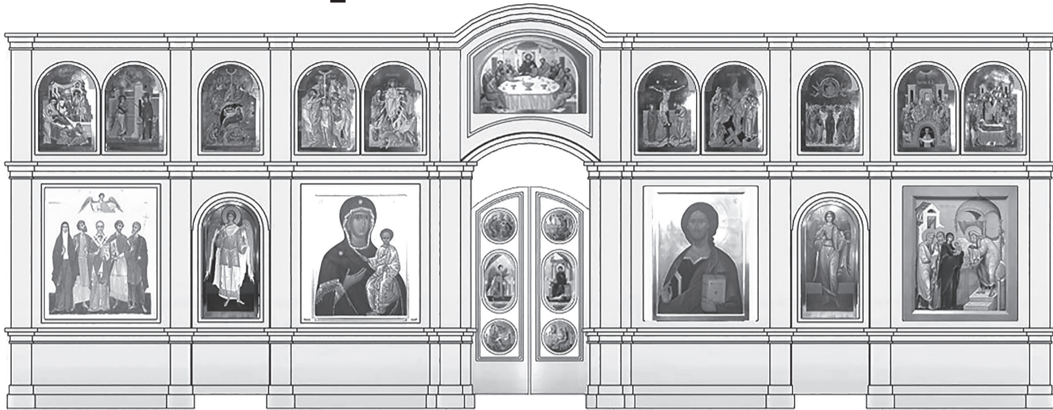
Новый двухрядный иконостас разместят в нижнем приделе храма