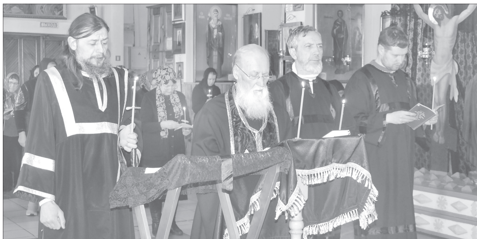
Литургии сейчас служат в чёрном облачении

■ КСТАТИ. Таинство Соборования (Елеосвящения) Великим постом в Успенско-Никольском храме будет совершаться 25 и 30 апреля.