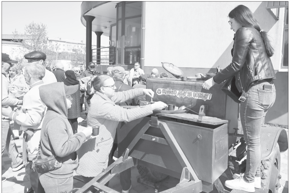
Фестиваль «Солдатская каша» в прошлом году прошёл впервые и очень понравился горожанам, поэтому его решили повторить

С 13 марта стартовала акция по сбору средств «Мы с тобой, ветеран», руководите-