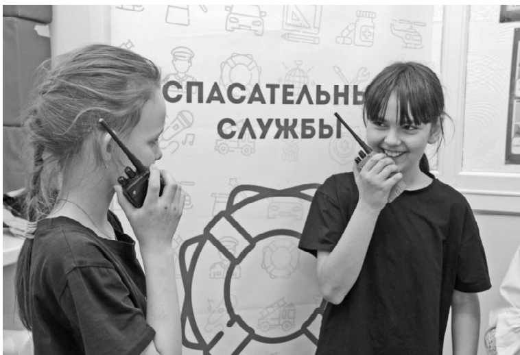
➤ На профориентационной экскурсии в ВСОШ №1