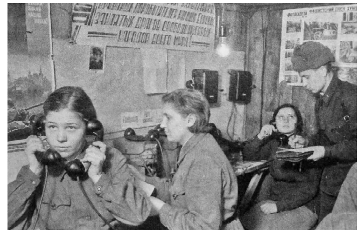
Работа связистов на фронте считалась одной из самых опасных. Их задачей было наладить бесперебойную связь, а в случае обрыва исправить повреждения