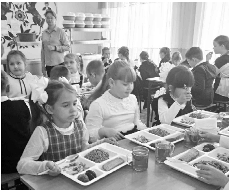
Школьникам в столовой полноценный обед раскладывается в специальные менажницы. В большое блюдо, разделенное внутри на несколько ячеек, можно положить разную еду, не смешивая ее между собой