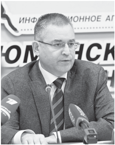
Игорь Халин |

В минувшее воскресенье, 10 сентября, в Тюменской области, включая Ханты-Мансийский и Ямало-Ненецкий автономные округа, состоялись выборы губернатора области. Об их итогах на следующий день рассказал на пресс-конференции председатель областной избирательной комиссии Игорь Халин. Подробности – в материале наших коллег из информационного агентства «Тюменская линия».