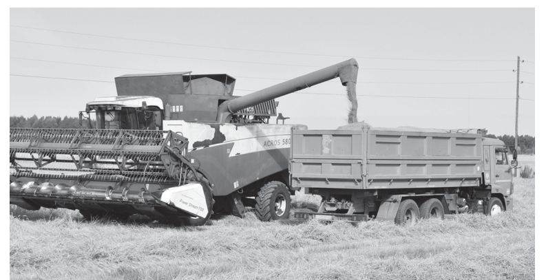
гектара. Уборка его завершена – собрано 25 тонн.