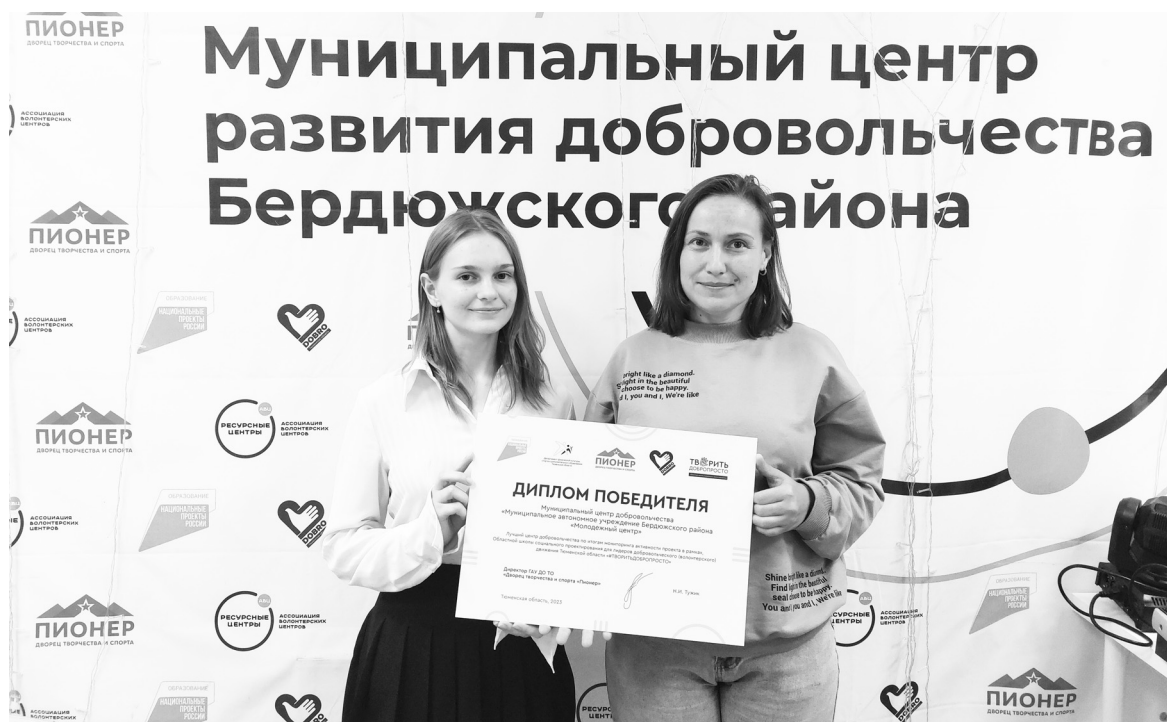
Проект Молодежного центра отметили в Тюмени, теперь эту идею предстоит развивать

как бы сделать наши баннеры стационарными, на постоянной основе разместить их в центре нашего села, обустроить сквер, оформить клумбы и цветники. В таком месте можно будет проводить различные патриотические мероприятия, тематические занятия, экскурсии для детей и взрослых, отмечать памятные даты и праздники. Знакомиться с историей нашей страны, говорить о подвигах земляков, поддерживать связь поколений – приглашать тружеников тыла, членов районного совета ветеранов.