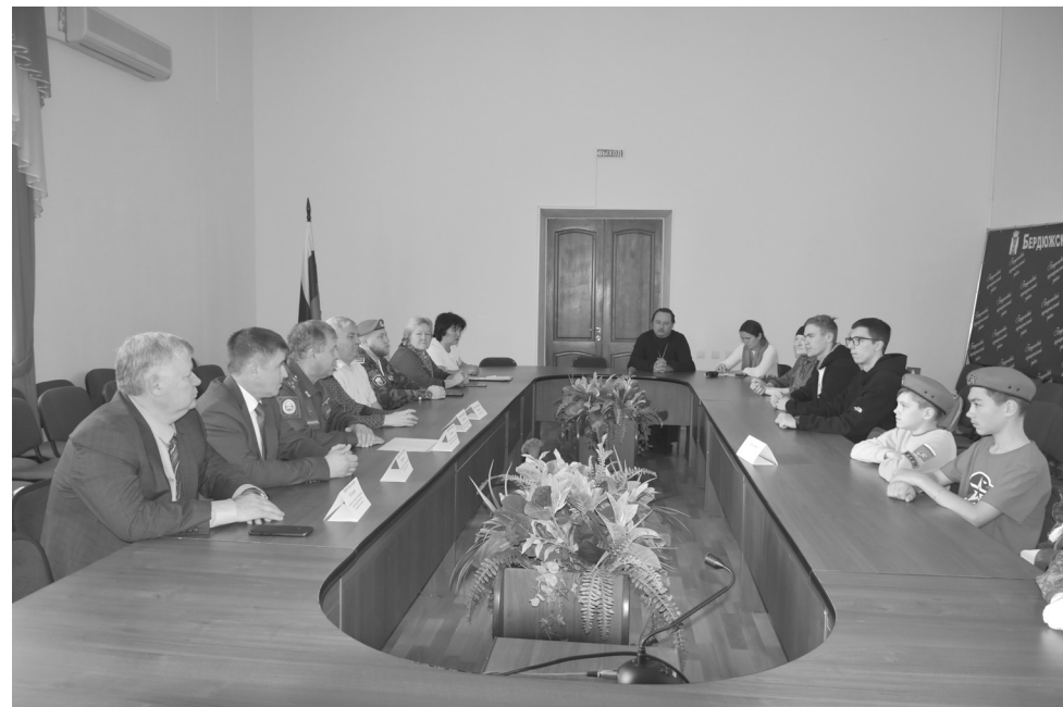
За круглым столом обсуждали вопросы призывной кампании