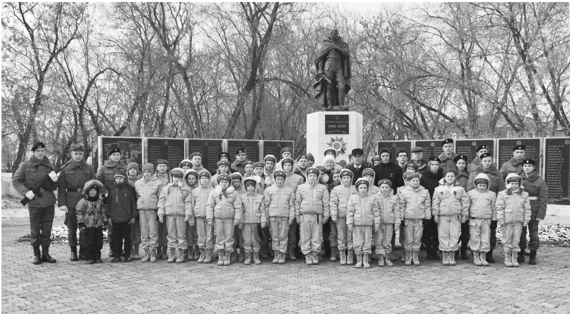
После торжественного митинга фотография на память с кадетами и юнармейцами