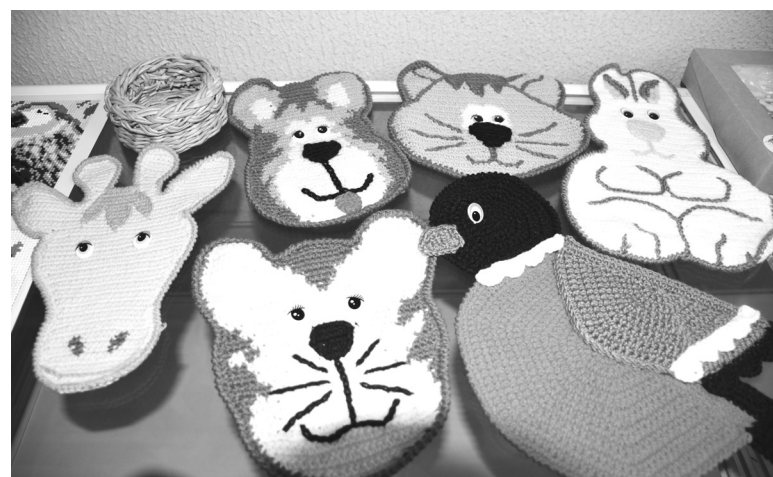
Творческие работы рукодельниц помогли провести мастер-класс по фотосъемке