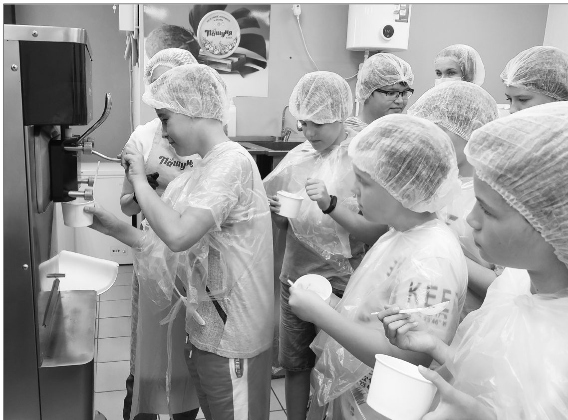
Очередь за полезным десертом на тюменской фабрике.

Пролетая над гнездом кукушки. «Мы люди сибирские, в нашем климате без мяса не прожить», – распространённое ментальное клише с доброй долей здравого смысла.