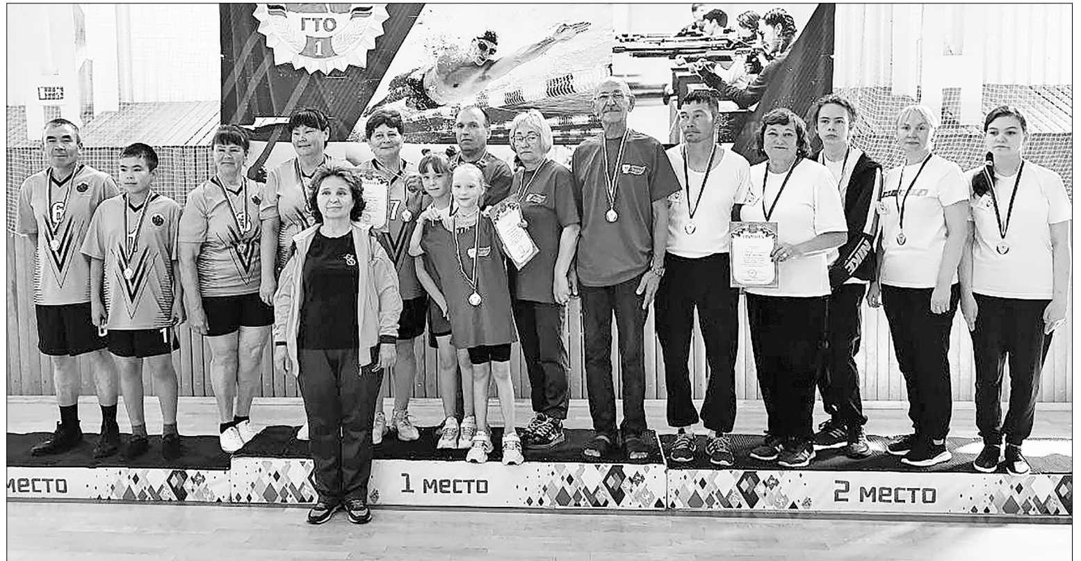
Участники соревнований.

А теперь, дорогие читатели, давайте познакомимся с командами-участниками. Прибыли на состязания ветераны из Антипино, команда «Максимум» из Картымского, «Динамо» – ве-