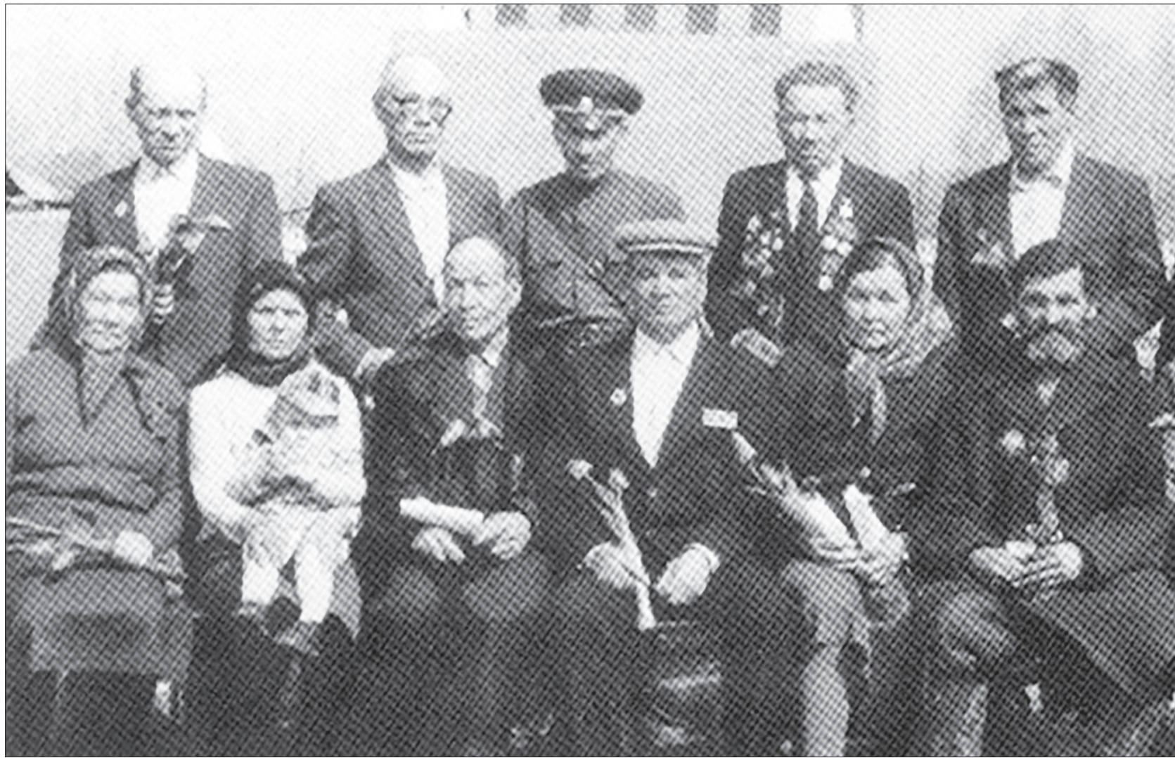
Ветераны войны и тыла д.Канаш, 9 мая 1989 г.