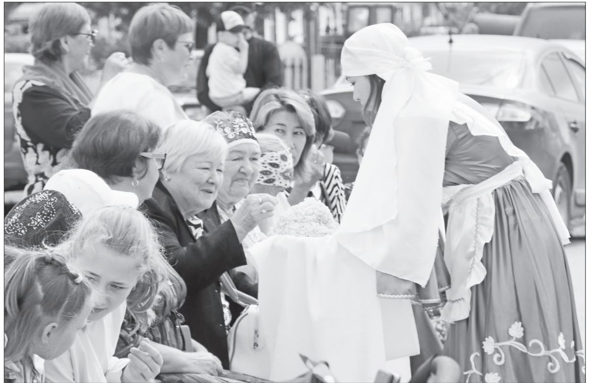
Перед началом торжества гостей Сабантуя угостили национальным блюдом чак-чак.

Церемония награждения чередовалась с музыкальными подарками от творческих коллективов Киндерского СДК,