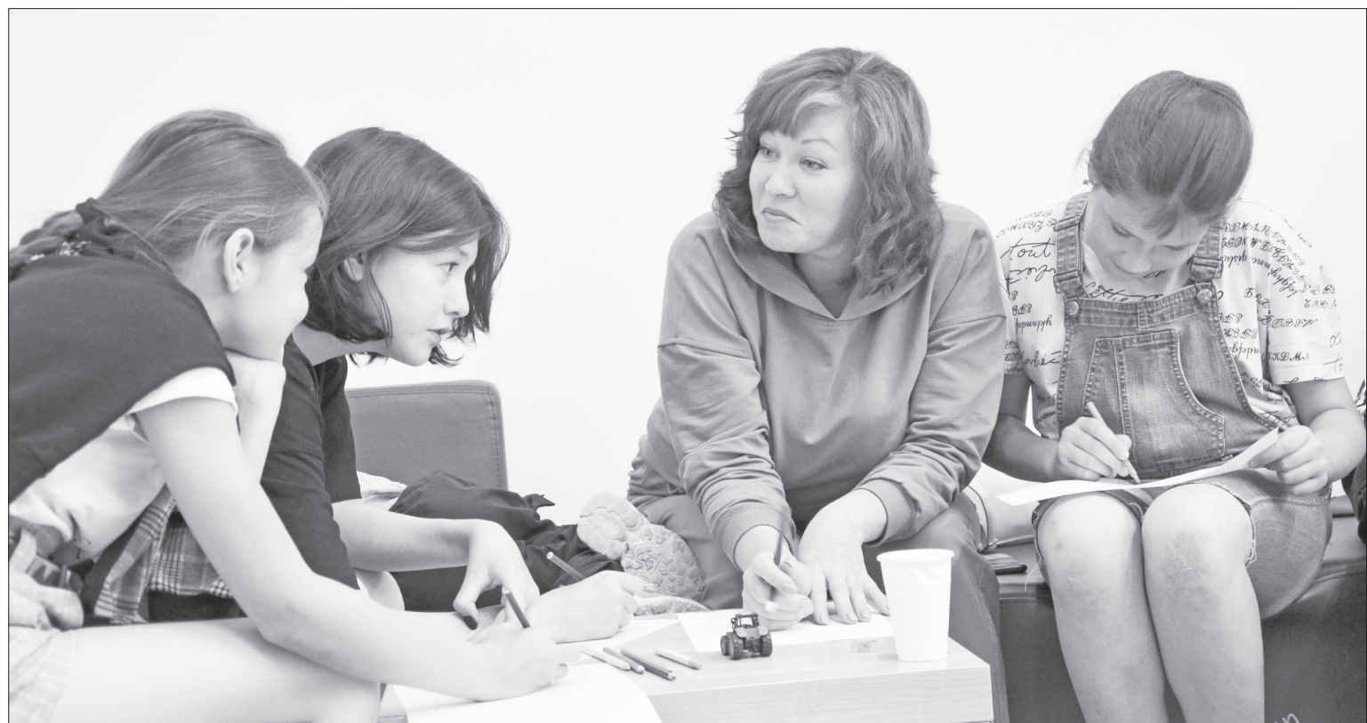
Моменты стартовой встречи семейного марафона: участники отражают в рисунке то, что для них значит слово «семья».

– Активные жёны участников специальной военной операции однажды поблагодарили нас за работу и сказали, что готовы присоединиться к работе социальных гостиных,