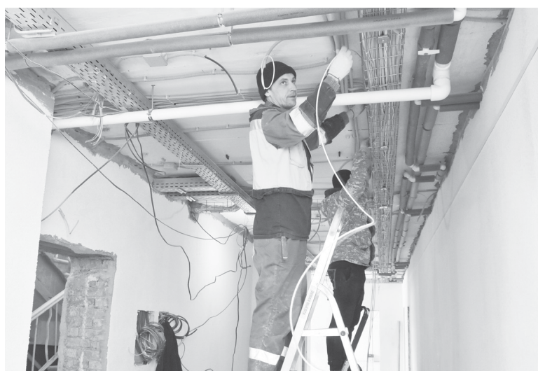
Внутри здания полным ходом идут отделочные работы

школа была построена в 1968 году и с тех пор капитально не ремонтировалась. Ремонт был начат в 2022 году. Точнее, его можно назвать новым строительством, так как от здания остались только несущие стены. Всё остальное