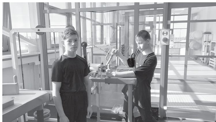
Желающие могли испытать свою силу на тренажёрах в СК «Ярково»

Весенние каникулы – это замечательная возможность с пользой провести свободное время, отдохнуть, набраться сил перед финальной четвертью.