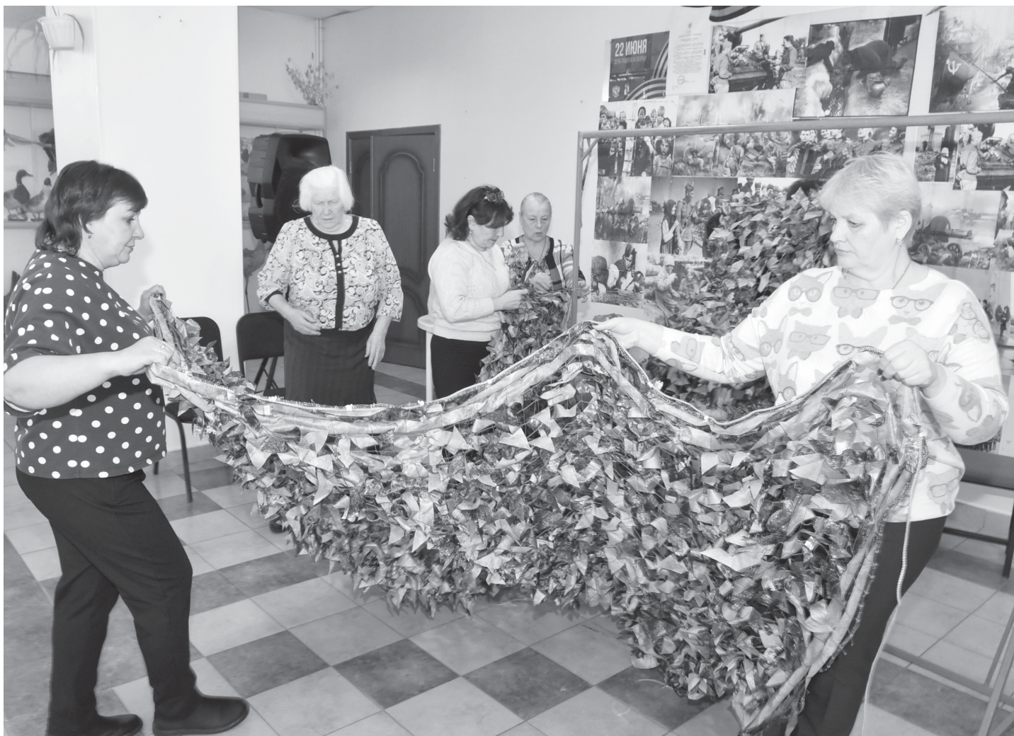
Женщины-волонтёры из Покровского заняты изготовлением маскировочной сетки

О необходимости сплотиться для решения общей задачи в условиях специальной военной операции задумываются многие люди. Жительницы села Покровское активно присоединились к волонтерскому движению.