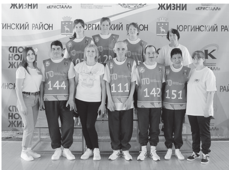
Команда Ярковского дома-интерната для престарелых и инвалидов

Ярковский район представила команда из девяти человек. Победителями в соревнованиях по