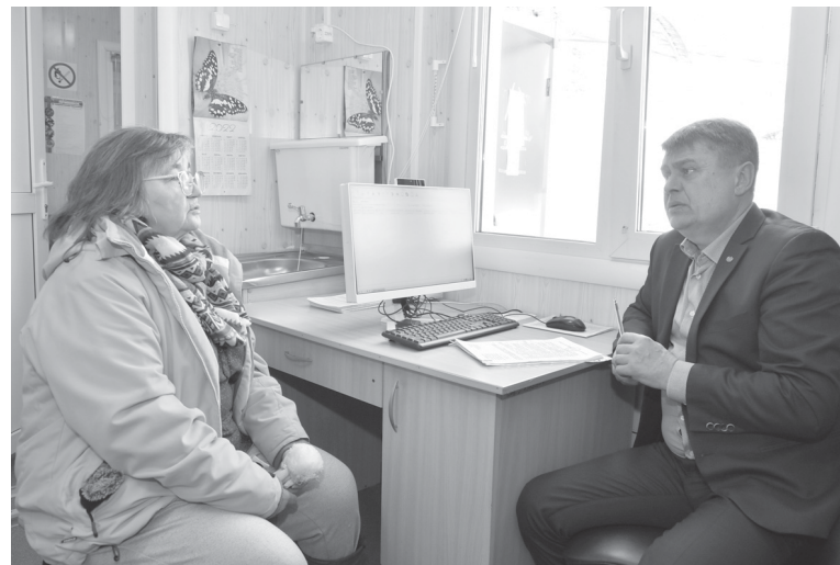
Первым делом глава района провёл встречу с жителями Никитиной