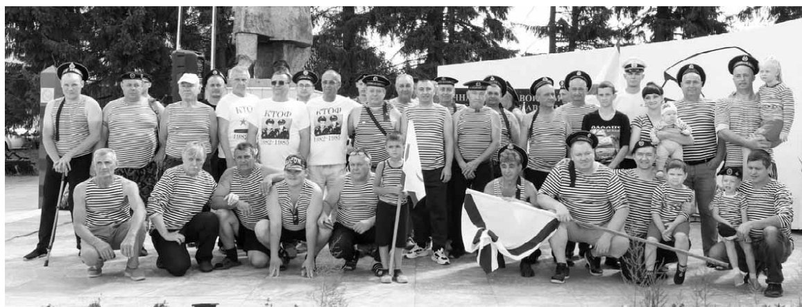
Ветераны ВМФ чтят флотские традиции и ежегодно собираются на товарищеские встречи